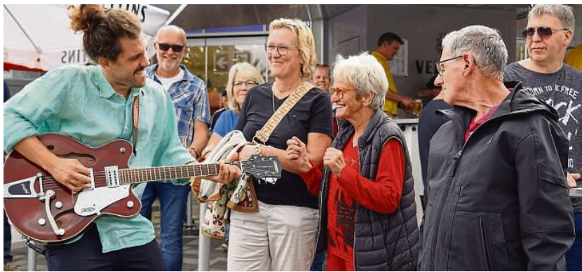
Abwechslungsreiche und handgemachte Live-Musik in der Fußgängerzone: Schon die Premiere 2022 war ein Riesenerfolg, vom 31. August bis 1. September folgt die dritte Auflage des Hanse-Festivals.

Gemünden Stadt: 06453/ 91230. Haina/Kloster Bürgerbüro: 06456/92890-00, 7.30 - 12, 13 - 16 Uhr. Post Löhlbach: 8-18 Uhr, Tank- stelle Landau, Zur Aulisburg 4. Hatzfeld Stadt: 06467/ 9120-0, 14 - 16 Uhr. Sternsinger unterwegs: ab 13 Uhr in Hatzfeld, Holzhausen und Reddighausen. Rosenthal Stadtbücherei: 16- 17.30 Uhr. Stadt: 06458/ 50950, 8 - 12, 14 - 16 Uhr. Vöhli Nationalparkzentrum Herzhausen: 10-16.30 Uhr. Synagoge Vöhli: 19 Uhr Kino.